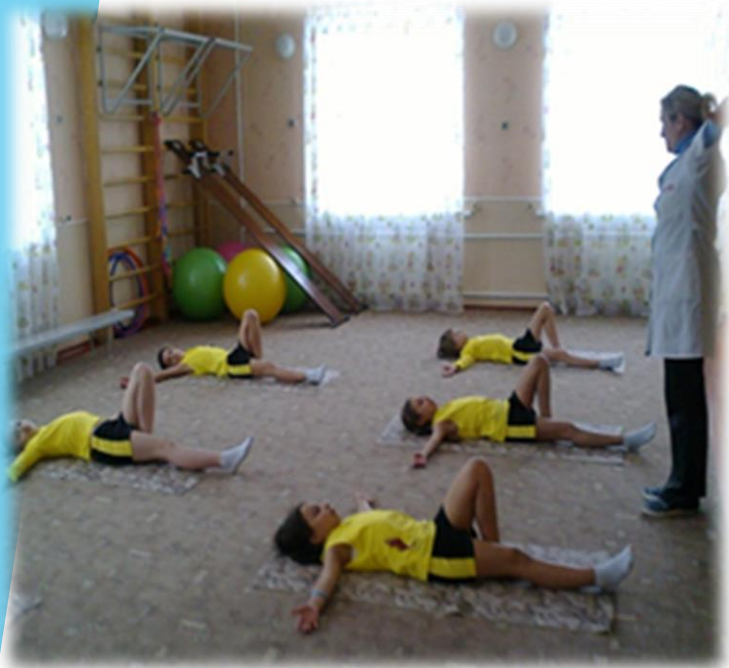
Лікувальна фізкультура, заняття на дошці Евмінова