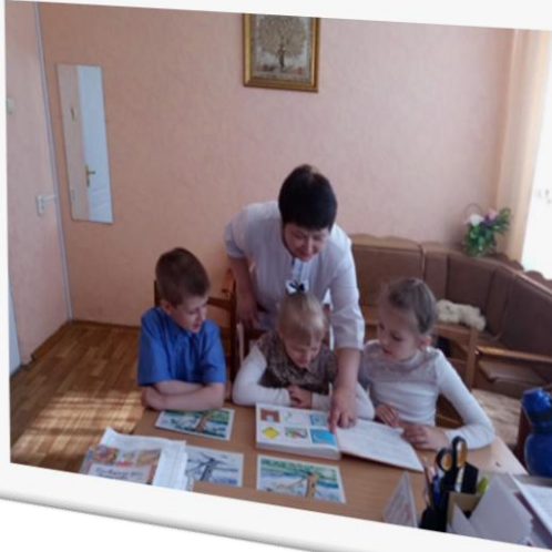
Співбесіди із лікарем-психіатром