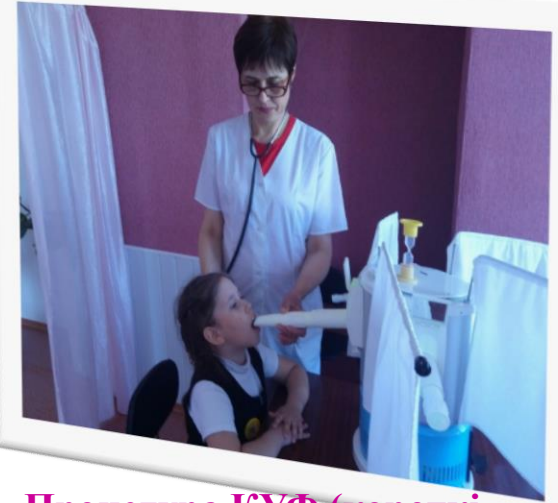
Процедура КУФ (короткі ультрафіолетові промені)