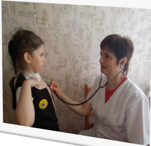
Загальні огляди лікаря-педіатра