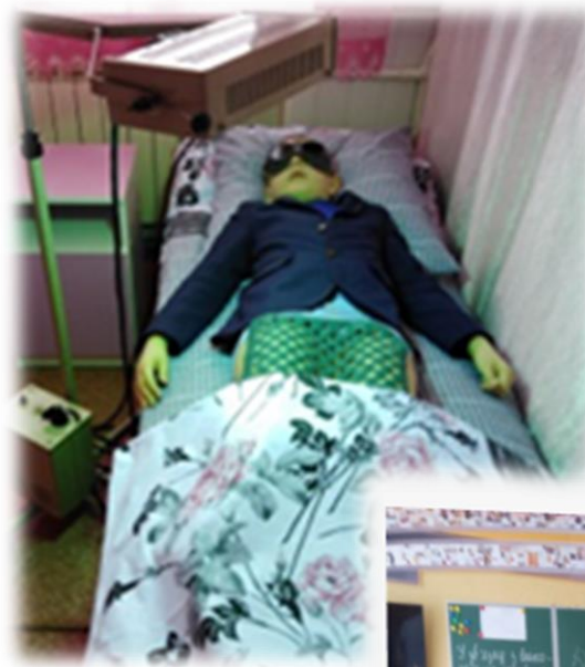
УФО рефлексогенних зон