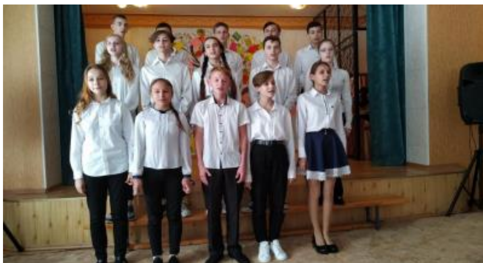
Концерт до Дня працівників освіти