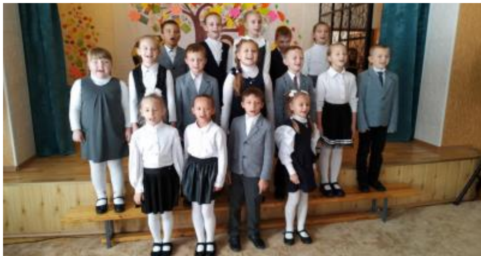
Концерт до Дня працівників освіти