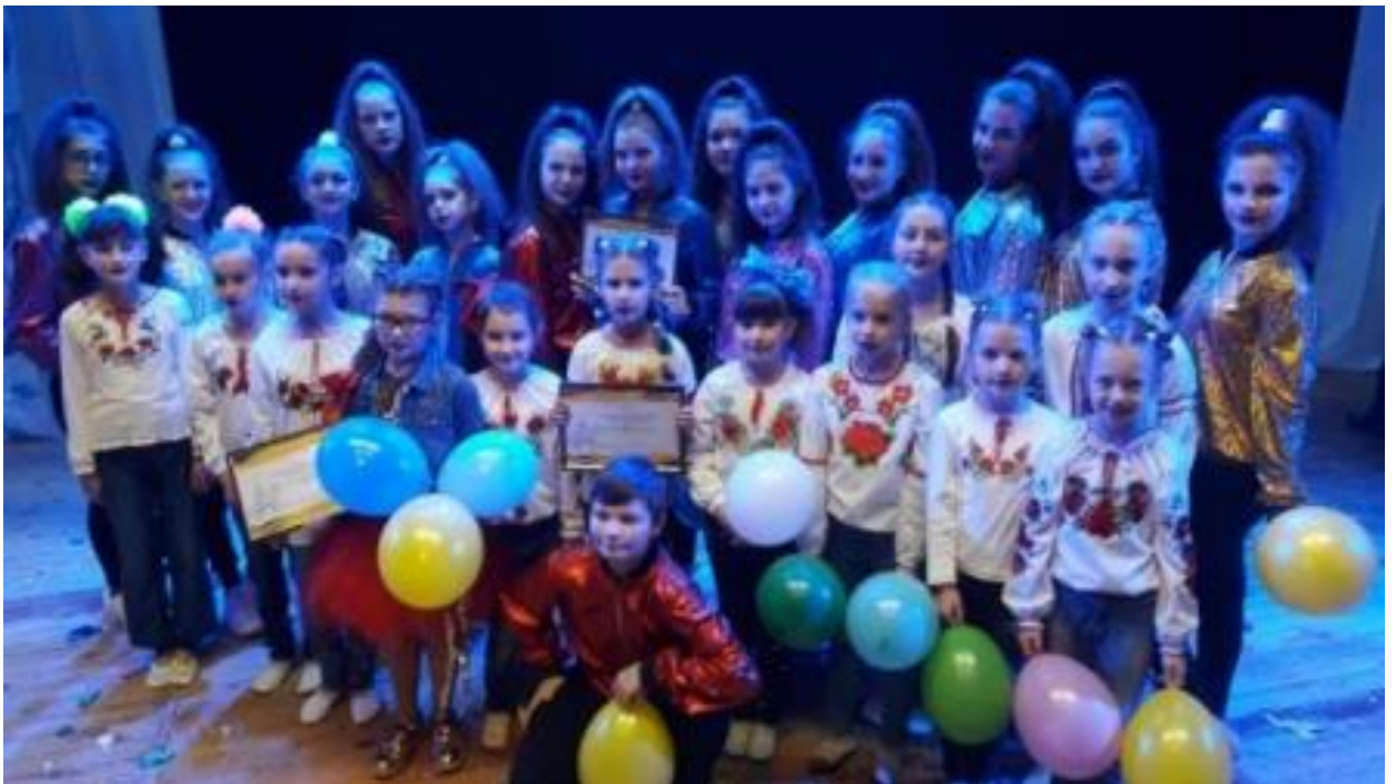
Міський фестиваль «Натхнення -2019»