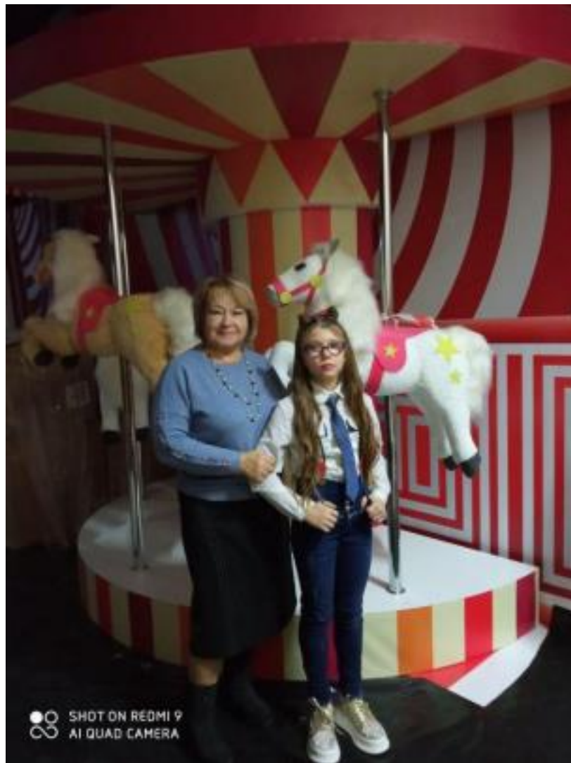
Міський фестиваль «Натхнення -2020»