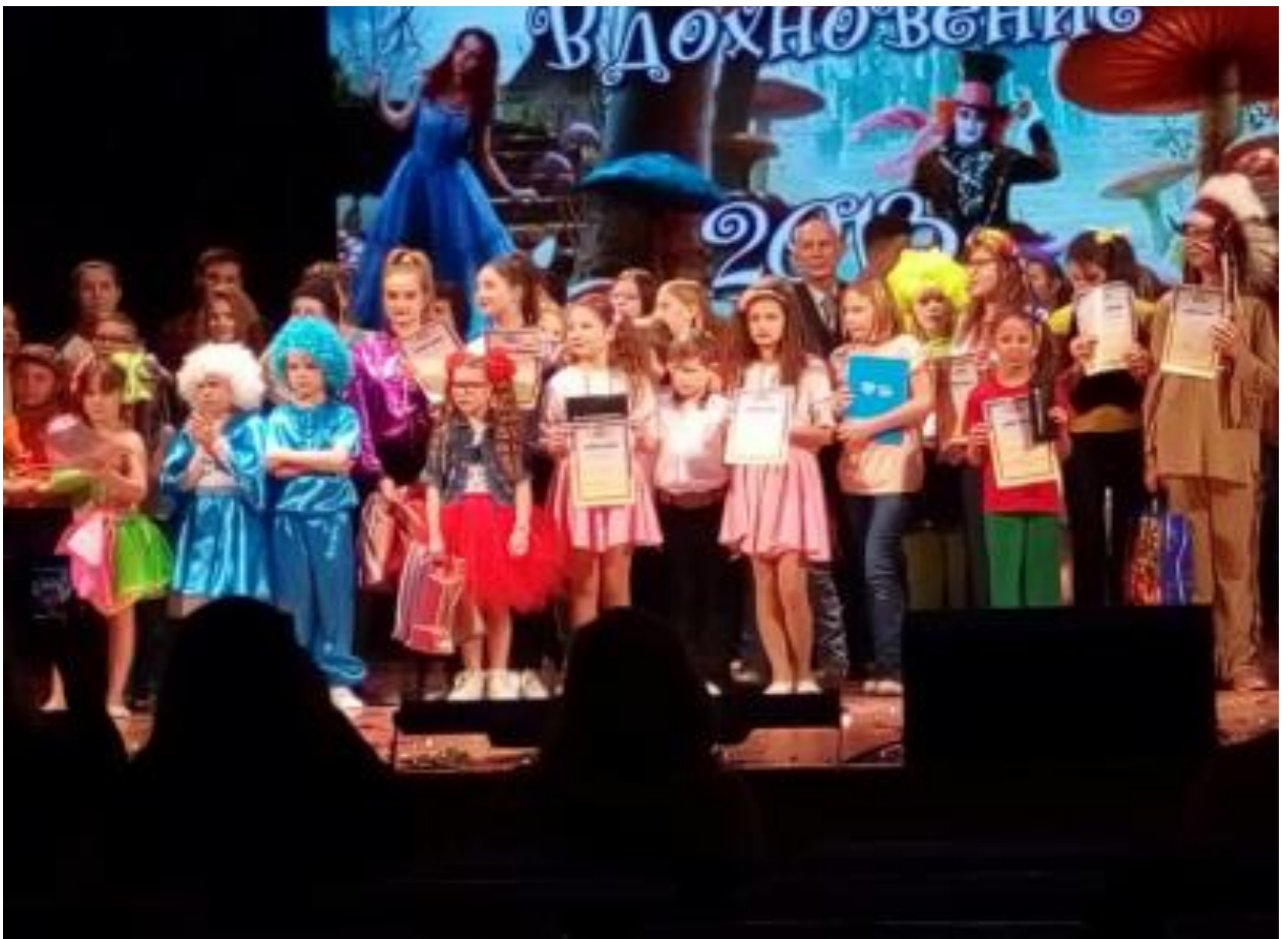
Вручення Гран-прі 2018