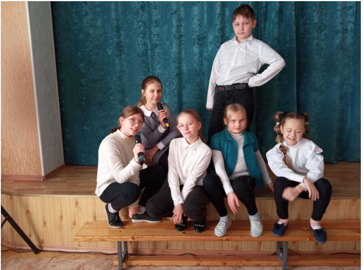
Заняття вокального гуртка «Домісолька»