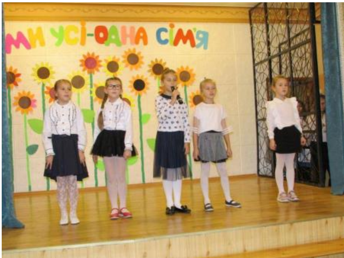
Виступ молодшої групи ансамблю «Гарний настрій» на концерті присвяченого «Дню сім'ї»