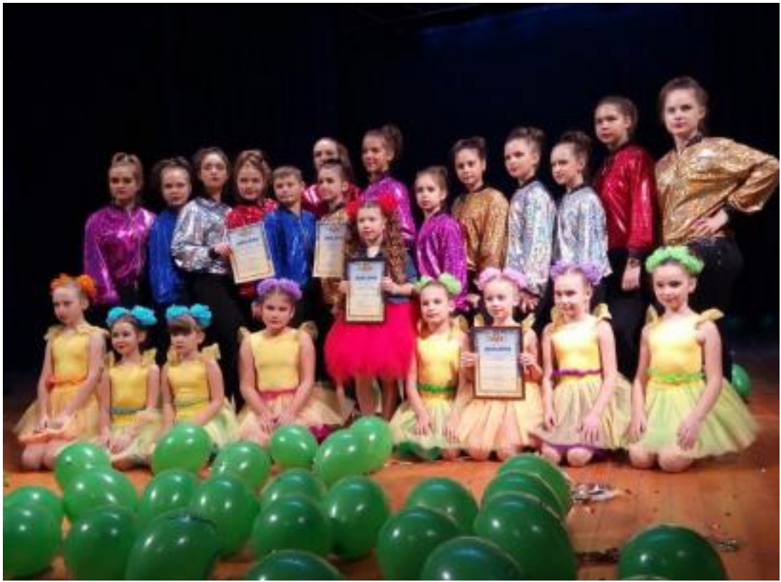
Переможці конкурсу «Натхнення»