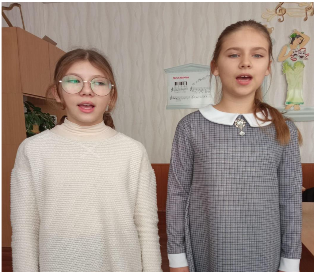
Заняття вокального гуртка «Домісолька»