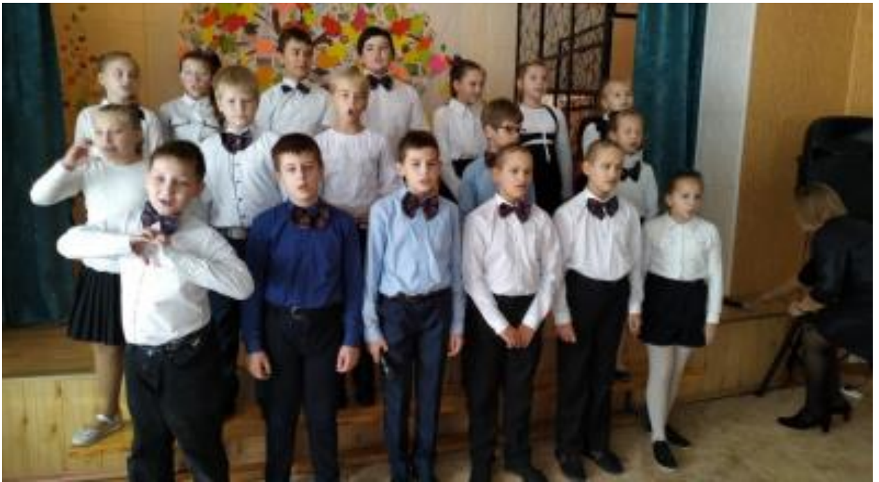
Концерт до Дня працівників освіти