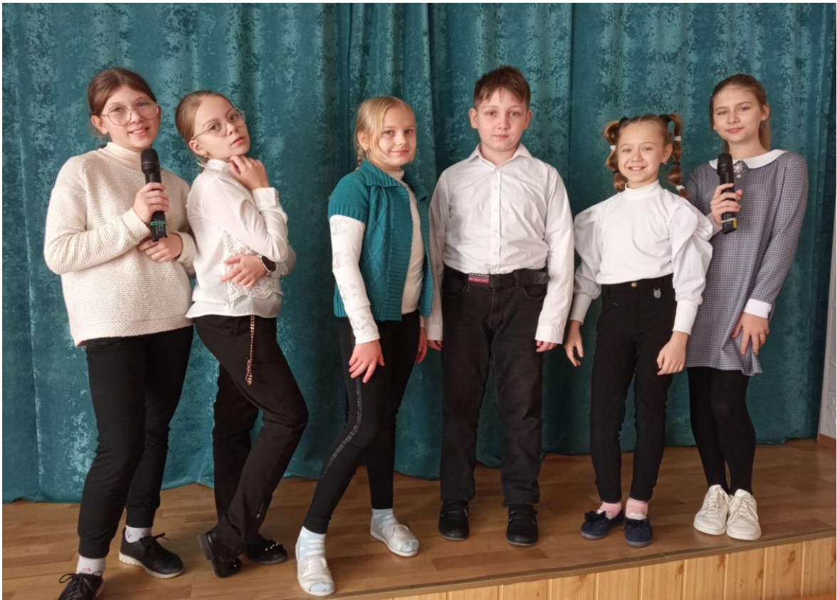
Заняття вокального гуртка «Домісолька»