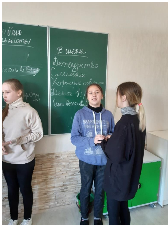
Вправа: «Відповідальна поведінка»