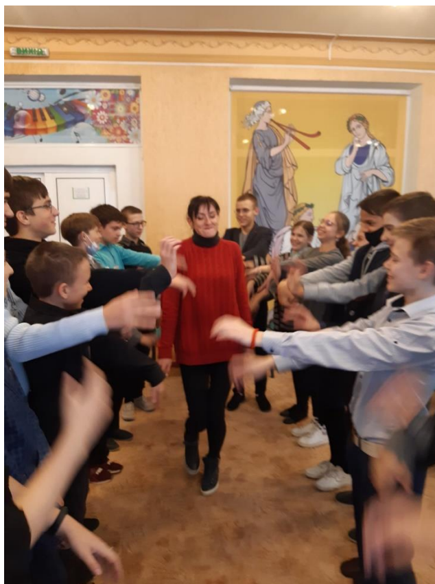
Руханка «Пральна машина»