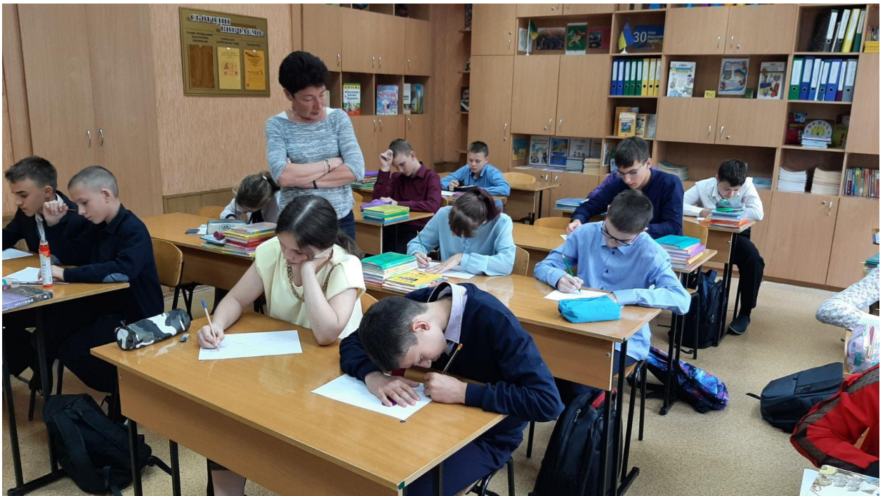
Вправа: «Моя зірка»