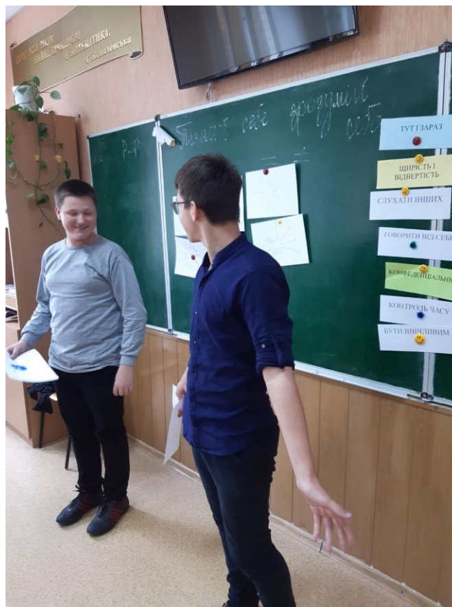
Вправа: «Правила роботи»